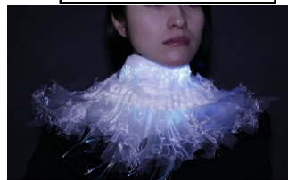
ファッション×テクノロジー